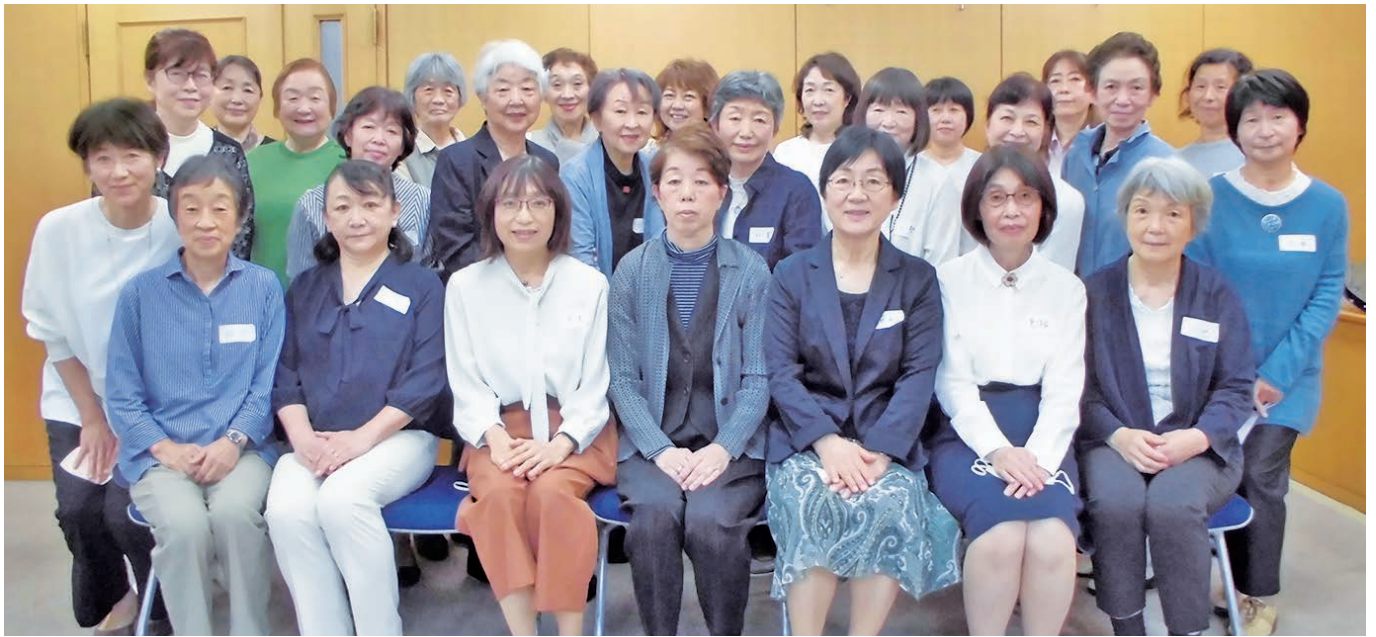
令和5年5月30日(火) 総会